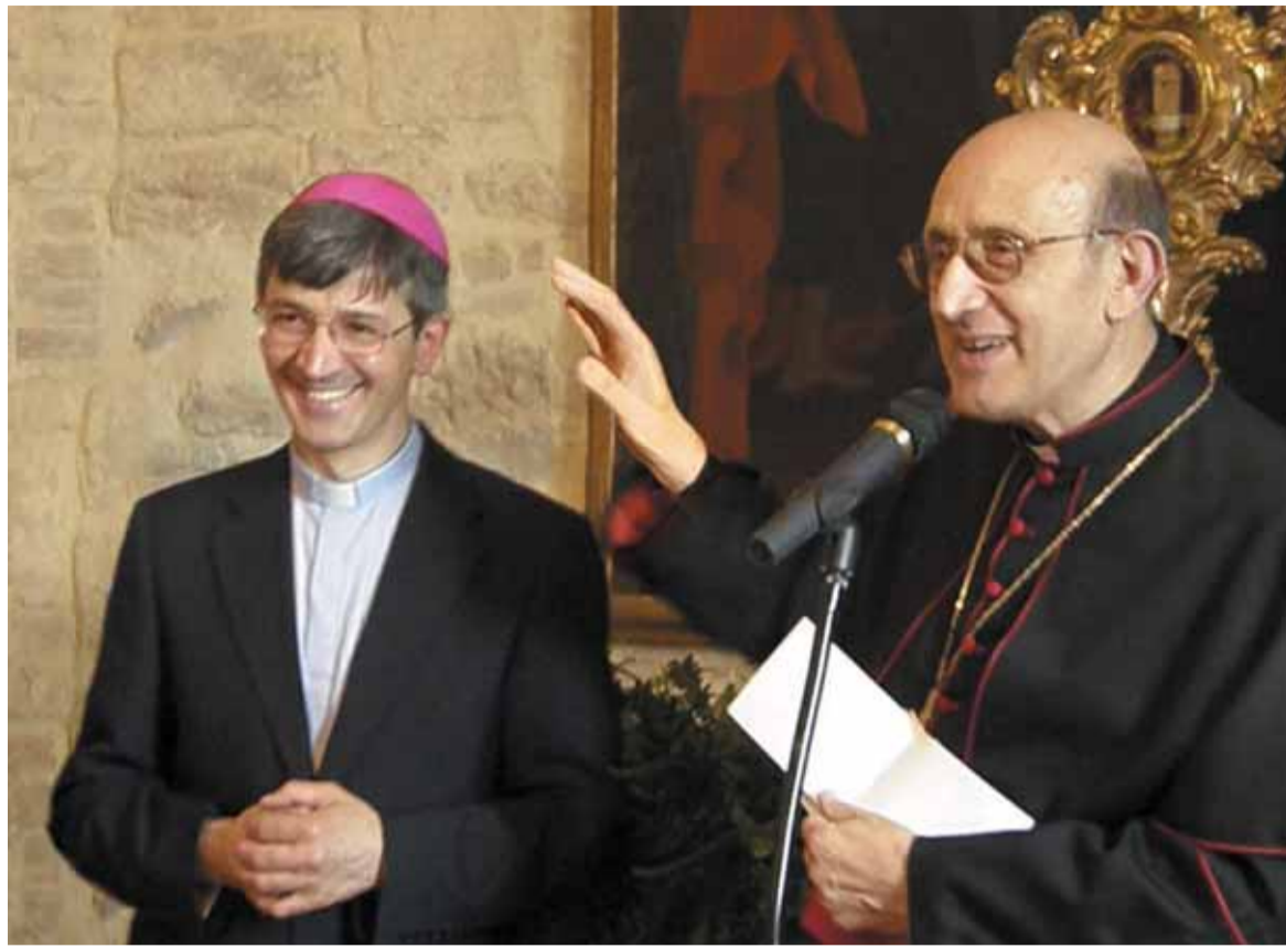
Mons. Gualtiero Sigismondi con l'arcivescovo di Perugia mons. Giuseppe Chiaretti il giorno dell'annuncio della nomina a vescovo di Foligno

Una persona per natura schiva, riservata, dopo la nomina a vescovo di Foligno è stata costretta ad aprirsi e a parlare di sé rispondendo alle domande dei giornalisti e delle persone interessate a conoscere la vita e la personalità del futuro prelado. D'altra parte, diventa ancora di più un personaggio pubblico sia di fronte alla Chiesa diocesana che alla società civile cittadina e regionale. Su questo giornale ne abbiamo già dato uno