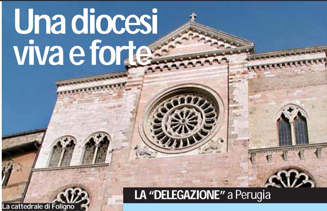
La cattedrale di Foligno

L'ordinazione episcopale di mons. Gualtiero Sigismondi, vescovo eletto di Foligno, è occasione ideale per tracciare uno spaccato della realtà della diocesi alla quale è destinato. Anzitutto i numeri: la diocesi di Foligno si estende su una superficie di 350 chilometri quadrati e comprende i Comuni di Foligno, Spello e Valtopina, oltre a una piccola frazione di Assisi, per un totale di circa 67 mila abitanti. Dal punto di vista pastorale conta 39 parrocchie, 200 chiese, 5 zone pastorali, 46 sacerdoti diocesani, 32 sacerdoti religiosi, 125 religiose, 15 diaconi permanenti, 25 confraternite, 9 centri caritativi-sociali, 26 tra associazioni, gruppi e movimenti, 3 scuole cattoliche, la Scuola di formazione teologica, il settimanale diocesano Gazzetta di Foligno e la radio diocesana Radio Gente Umbra. Tra i beni della diocesi di Foligno ci sono importanti istituzioni culturali come la biblioteca "Lodovico Jacobilli", il Museo diocesano e comunale di Spello e il Museo capitolare diocesano. In costruzione ci sono due importanti strutture: la nuova chiesa di via del Roccolo, disegnata dal celebre architetto Massimiliano Fuksas e realizzata con il contributo della Conferenza episcopale italiana, e il nuovo centro dedicato alle attività della Caritas diocesana. "Al di là dei numeri e dei beni presenti - spiega mons. Giuseppe Bertini, vicario generale della diocesi di Foligno - si tratta so-