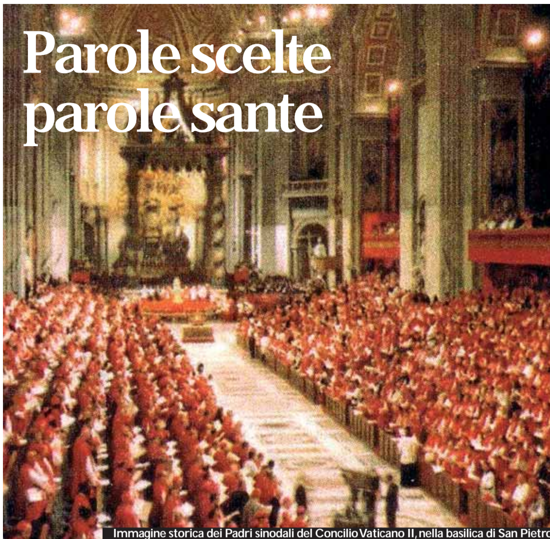
Immagine storica dei Padri sinodali del Concilio Vaticano II, nella basilica di San Pietro

Acribia e passione filologica preparano al volume successivo,